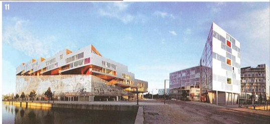
לינק לאתר של האדריכל באתר בניין ודיור - www.bvd.co.il

אין חומר אחד המועדף עליו באופן קבוע בעבודותיו. על בחירת החומרים בתוכניותיו משפיעים גורמים רבים, בהם כלכליים, לעיתים, גם שיקולים מסחריים, כמו הבטון למשל, תחום שהתעשייה בדנמרק מפתוחה בו מאוד.