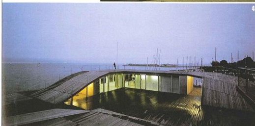
4 - Collapse chair 2 - פרוטוטיפ של כיסא מתקפל עשוי ריקט מצופה לוק. 3 - VM House, Denmark, Copenhagen - בניין מגורים, מתוקצב נמוך כחלק מתכנון שכונה שלמה בקומהגן. 4 אכטניית נוער ימית בקופנהגן, דנמרק.