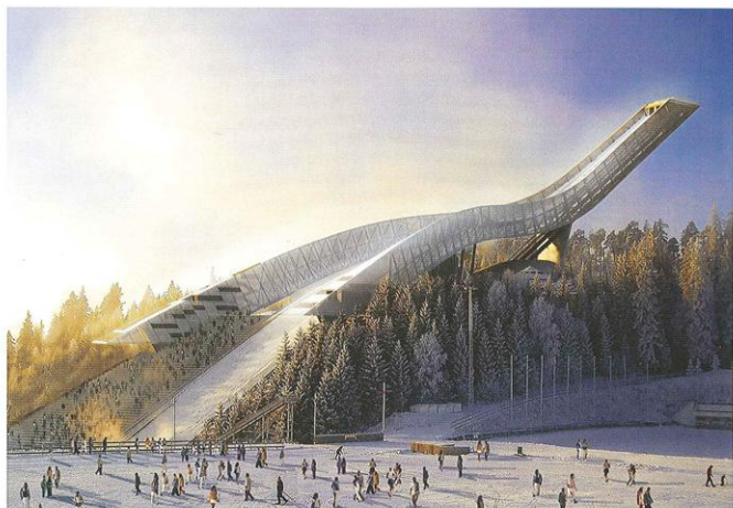
New Holmenkollen Ski Jump, Norway, Oslo - אתר סקי מלאכותי בעיר אוסלו שבנורווגיה, מדינה בעלת מבנה טופוגרפי שטוח.

כאשר הקים את משרד האדריכלים שלו JMS בשנת 2006, כבר נזקפו לזכותו פרסי אדריכלות מוערכים, שאותם הוא ממשיך לאסוף בדרכו להכרה בינלאומית