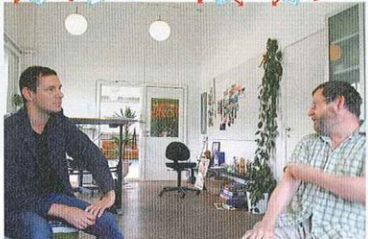
Julien De Smedt in gesprek met Lars von Trier, en ruimtelijkheid in beweging, uit 'Agenda'.