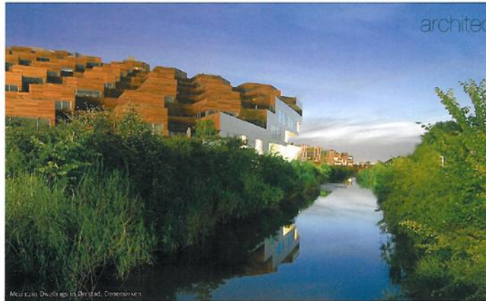
Maokun Dwelling in Dordrecht, Oost-Nederland