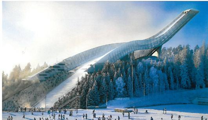
Skiachans in Oslo, Noorwegen (in uitvoering).