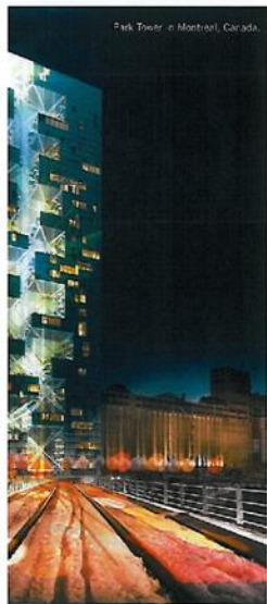
Park Tower in Montreal, Canada.