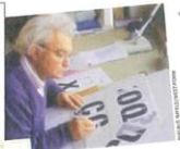
Adrian Frutiger, de gelauwerde typograaf. Linksboven: de cover van zijn boek en (onder) variaties op zijn letter, de Univers.