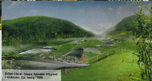
Bølger i Ao-ai, Taiwan. Arkitektur integreret i landskabet. Sår lært ig 2009.

- Filmprojektet kollapsede, og derfor faldt vi tilbage til, hvad vi kendte til, arkitektur. Vi dannede i januar 2001 tegnestuen PLOT.